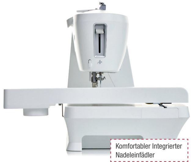
Komfortabler Integrierter Nadeinfädler